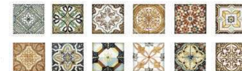
Central decor glossy finish