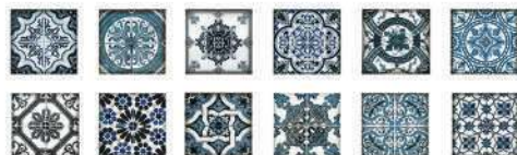
Central Decor glossy finish